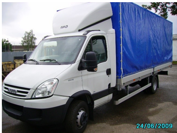
ilustračný obr. 1

Technická špecifikácia valníka : dvojstranná zhrňovacia plachta